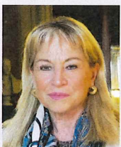
Catherine Dumas Sénatrice Conseillère de Paris Élue du XVII e arrondissement