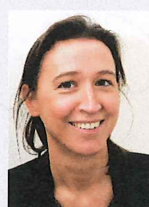
Clara Lees Attachée parlementaire

Sénat, Palais du Luxembourg, 15, rue de Vaugirard 75291 Paris Cedex 06 Tél : 01 42 34 33 98 Courriel : c.dumas@senat.fr Twitter : @catherine_dumas Site : www.direct-dumas.fr