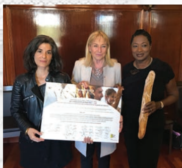
Comité de soutien Paris - Ile de France.