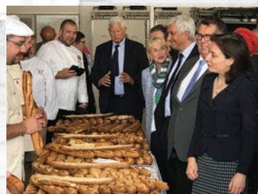
Concours de la meilleure baguette de tradition nationale.