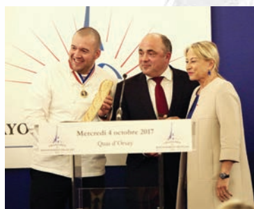
La baguette primée lors du prix du rayonnement 2017.

La baguette traditionnelle française est candidate pour entrer au patrimoine immatériel de l'UNESCO. Ce classement distingue l'attachement d'une population, sur la durée, à une tradition, un savoir-faire. À l'image de la pizza en Italie, qui a obtenu cette reconnaissance en décembre dernier, le classement UNESCO permet à une communauté, voire tout un pays, de se pencher sur un élément constitutif de son identité qui, si on n'y prend garde, au fil du temps, tend à se fondre dans la mondialisation parfois via un détournement par l'industrie. La vraie baguette, dite de tradition, est issue du savoir-faire d'un boulanger qui n'utilise que des produits simples (eau, sel et farine). Ce produit doit donc être reconnu pour être protégé !