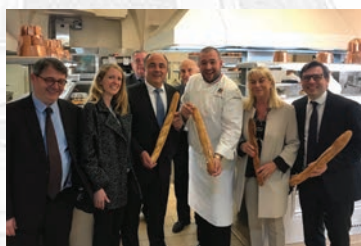
Délégation reçue dans les cuisines de l'Elysée.